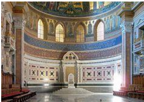
St. Paulus buiten de muren.