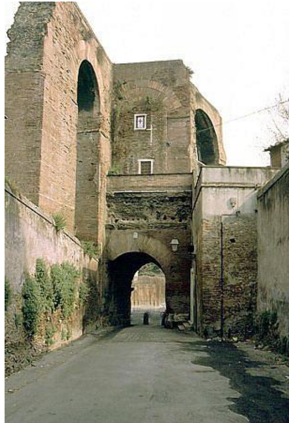
Boog van Dolabella.

wikipedia is het altaar gemaakt door de Florentijnse kunstenaar Bernardo Rossellino, er staat daar niets bij dat op 'bakker' lijkt) Rondom de kerk ziet men de afgrijselijkste schilderijen van verschillenden Martelaars, levensgroot. Men kan die schilderijen met geen droogen oogen bezien. Eer men aan die kerk komt is er nog een kerk op een hoogen berg, Kerk van den H. Gregorius waar men kan zien de tavel waar dat de H. Man dagelijks twaalf armen menschen aan spijsden en eens had hij er dertien aan tavel. De dertiende verdween onzichtbaar en was een engel.