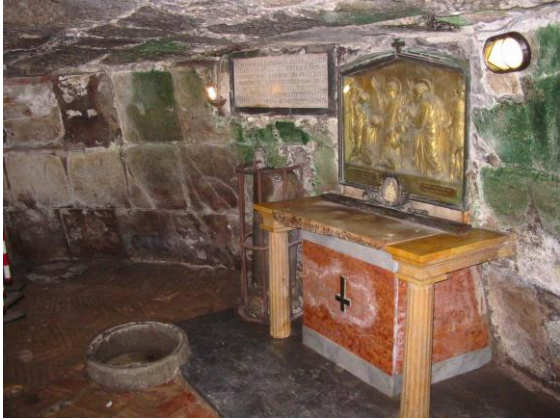
Mamertijnse Gevangenis.

in. Het gat is nog aanwezig waar men de H. Petrus door geworpen heeft en de H. Petrus viel met zijn gezicht tegen de muur en het gezicht bleef tot nagedagtenis in de muur staan.