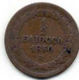
Munt Pauselijke Staat – 1/2 Baiocchi.

Baiocchi daags traktement kregen en twee baiocchi vertegenwoordigd wel een waarde van vijf centen volgens Hollands geld maar wij kunnen er in Rome niets meer voor koopen als bij ons voor een sent. Omdat er zijn Baiocchi en halven Baiocchi, dus komt men in een Kaffee bvb en men vraagt een kop koffie die kost een baiocchi en een broodje zoo groot als bij ons een kadetje kost ook een baiocchi. Dus op was mijn tractement. En natuurlijk heeft men meer nodig als koffie.