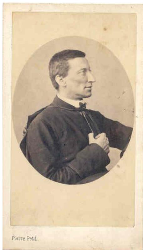
Portretfoto van Mgr. de Merode (Kamerbeer van Paus Pius IX).