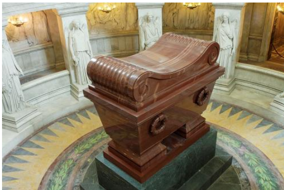
Graf van Napoleon. (internet)

beter was als toen ik naar Rome ging. Ik kreeg een plaats in de kajuit om te slaapen en ook eten en drinken op mijn tijd. Het was wel niet zoo fijn, maar voldoende. Ik was zeer tevreden of het kwam dat er meer betaald was voor mij of dat er niet zoo veel Passasiers op de boot waren als vroeger, dat weet ik niet. Maar dat weet ik, dat ik tevreden was. De zee was zeer kalm en naar dat ik al spoedig mijn tol aan de zee betaald had was ik volgens twee dagen zeer gezond en kon ik mij op het dek zeer goed amuzeeren. Toen wij in Marseille aankwamen bragt Baron de Turk mij bij de Hollandsche Consul die mij geld gaf tot Parijs waar ik dan weer bij een anderen consul mij moest vervoegen om geld te vragen tot Belgie. Wij bleven een dag in Marseille en savonds gingen wij op het Spoor tot Parijs waar wij den volgend middag of tegen den avond aankwamen. De Baron zocht weer een goed logement op dat mij twee frank kosten. Hij ging naar een grooter Hotel. Nu, daar was hij ook Baron voor.