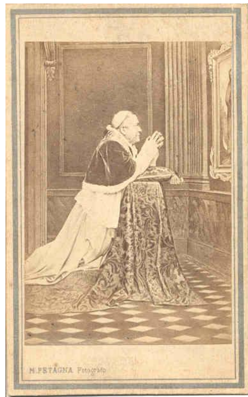
Paus Pius IX.

Hoe of ik weer op mijn plaats terug gekomen ben weet ik niet want ik was op dat moment geheel doordrongen van Godsvrugt en ik gevoelde mij niet dezelfden. Naar de H. Mis van Z.H. den Paus deed een kamerheer terstond een H. Mis waar Z.H. den Paus geknield op zijn bidbank bijwoonden.