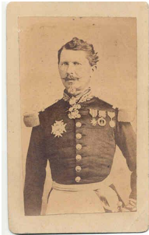
Portretfoto van Generaal Kanzler.

Uit Farnese had onze majoor naar de hoofdstad getelegrafeerd, zoodat we er niet onverwacht aankwamen. De opper-generaal, Kanzler, de generaals Allet en De Charette en verscheidene hoofdofficieren van 't Pauselijk leger wachtten ons af op 't perron en heetten ons vriendelijk welkom.