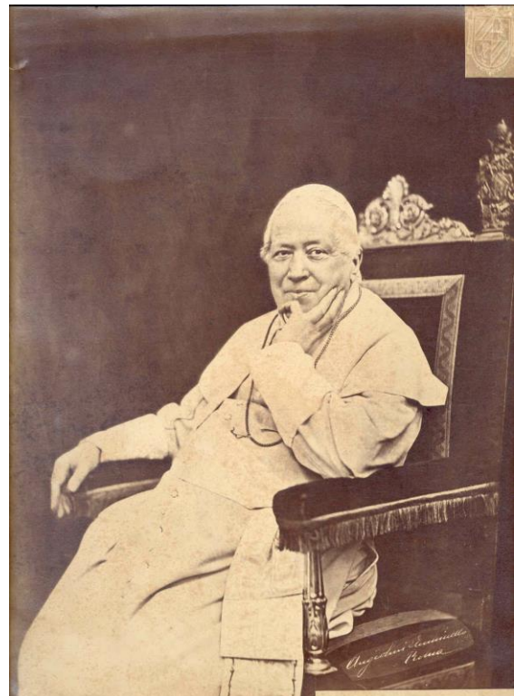
Paus Pius IX.

Nooit zal ik dien dag vergeten toen ik voor den eerste maal den zachtmoedigen Pius aanschoude.