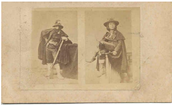
Afbeelding van "Italiaanse Volkstypes."

vertoefde nog lang want eerst moesten onze passen aan wal gebragt en getekent worden eer wij het schip mogten verlaten. Het gezicht van Civita Vecchia was mooi en ik was nieuwsgierig om eene schoone stad te gaan zien. Nogtans moest ik geduld hebben want toen wij van het schip afgehaald waren, stonden er gendarmen op de wal om ons eerst van de commissaris van politie te brengen, om aldaar na te zien of dat onze passen wel goed in orde waren om ons alzoo naar Rome te mogen begeven. Het was vier ure, onze passen waren gereed. Wij moesten ons haasten om naar het spoor te loopen, die denzelfden avond nog naar Rome vetrok. Wij liepen uit al ons naden, maar het was te laat. Het spoor was vertrokken en wij moesten naar Civita Vecchia terug. Wij vroegen daar naar een logement. Zij bragten ons in een huis, ik durfde niets te zeggen maar ik dacht wij zijn hier in een rovershol. Het zag er niet beter naar uit. Wij mochten daar eeten. O hemel, wat is het hier voor een huis. Het volk is stuursch en norsch. Zij keken ons aan of ze ons wilde opeeten.