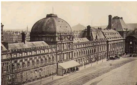
Tuileriespaleis voor 1871. Paleis van Napoleon III. (In 1871 door brand verwoest.)

ons terstond in een koffijhuis waar wij eene groten kop koffij kregen zonder melk, een broodje iets grooter als een hollandsch kadetje zonder boter en eene grooten lepel om dit op te eten. Dit was het eerste vreemde wat ik aan trof. Nogtans het smaakte mij goed. Verdrietig was het voor mij om op de vragen van sommige menschen niets te kunnen antwoorden. Zoodra den dag was aangebroken begaven wij ons in de stad Parijs. Wij gingen daar eenige schoone kerken zien en ook het Paleis van den keizer Napoleon III. Dit palis is wonderschoon anders kan ik er niets van zeggen want ik heb het maar voor een oogenblik gezien want wij hadden geen tijd. Wij moesten des middags nog vertrekken naar Marseille en om elf uure moesten wij nog dineren. Wij liepen nog wat door de stad, gingen nog naar een beestentuin die