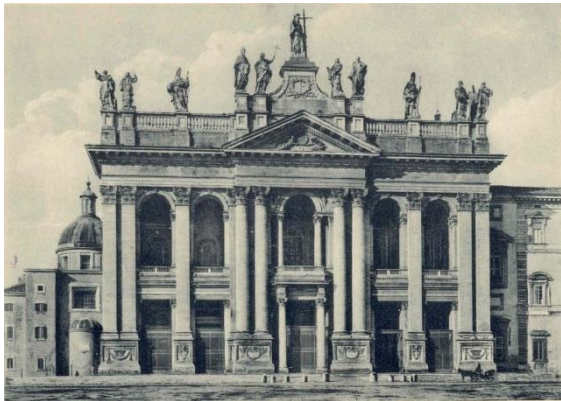
St. Jan van Lateranen.

Toen ik in de stad kwam viel het mij tegen, wel is waar het was regenachtig weder en alle straten waren vuil. Voor eerst door den regen en ten tweede door het geloop en gerij dat in de stad is en dan moet ik noch zeggen dat wij niet in het schoonste gedeelte der stad aankwamen. Naar noch eenigen oogenblikken gereden te hebben, kwamen wij in mooijer straten aan. De koetsier verhaaste zijne paarden en naar weinig tijds waren wij op onze bestemming. Zij bragten ons in een koloniaal gebouw van Rome, de Pilote genaamd. Het was daar waar wij moesten tekenen om soldaat voor de paus te worden. Hoogst verdrietig was het voor mij om noch niet eens te kunnen antwoorden van welk land ik kwam.