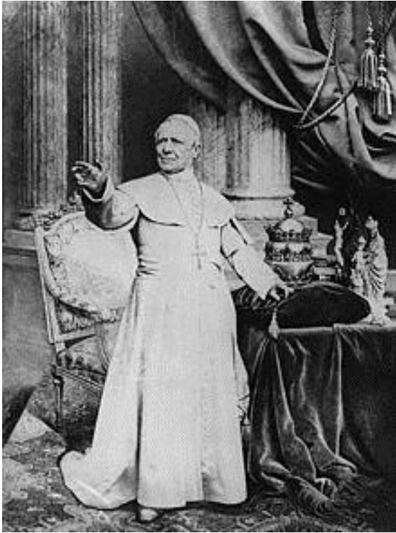
Paus Pius IX.

De fransche soldaten waren er met hunne kannone, ook de Koning en de Koningin van Napels, de Koninginbroeder en de Koningin van Spanje waren erbij. Dezen waren ook op witte donderdag bij alles tegenwoordig. De illuminatie (moet zijn illuminatie) die tweejaars plaatsheeft, te weten vandaag en op de feestdag van St. Pieter en Pouweles 29 Junij was uitgesteld tot Paaschmaandag. Toen stond de geheelen St. Pieterskerk, de geheelen colonades op het plein: in een woord alles in vollen vlam. Allen kolonen, ieder cornie van dezen onmetelijke bouw, de gehelen koepel tot aan den top van het Kruis waren met regenlampen behangen. Dezen illuminatie word in twee verdeeld, de eerste is genoemd de Zilveren. Dezen begint met de Ave Maria of Angelus en bestaat uit 5900 lantaarens. Welken zoo geplaatst zijn dat men niet de vlam maar slechts den schijn van het licht zien kan, hetgeen wonderlijk is. De tweede word genoemd de Goude en dezen begint een uur later. Dan worden als door een